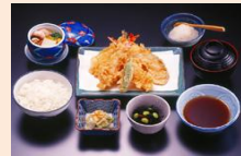
老舗の江戸前天ぶら