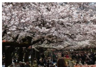
■上野公園 (写真はイメージ)