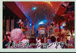
イルミネーションツアー