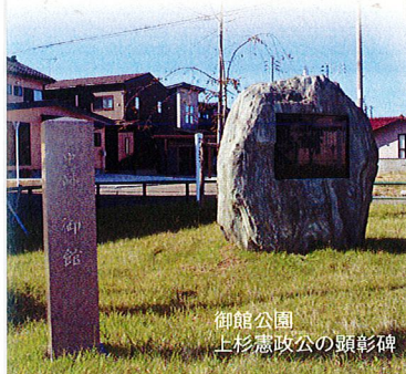
御館公園 上杉憲政公の顕彰碑