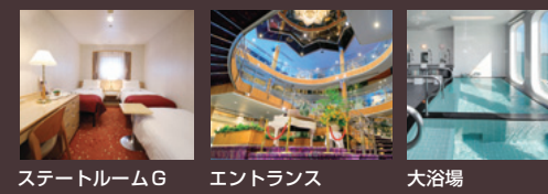
ステートルームG エントランス 大浴場